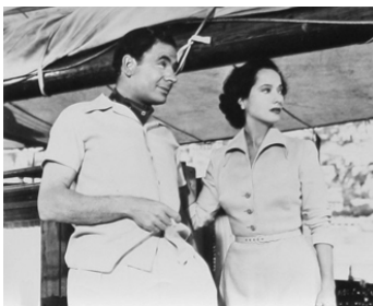
1952 L'INCONNU DE MONACO (24 Hours of a Woman's Life) de V. Saville avec Merle Oberon