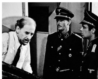
1974 DOCTEUR KORCZAK (Sie sind frei, Doktor Korczak) d'Aleksander Ford