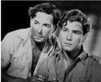
1950 LE CHEVAL DE BOIS (The wooden Horse) de Jack Lee avec Anthony Steel