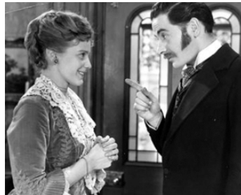
1951 LA BOÎTE MAGIQUE (The Magic Box) de John Boulting avec Maria Schell