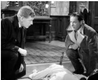
1965 PSYCHO-CIRCUS (Circus of Terror) de John Moxey avec Anthony Newlands