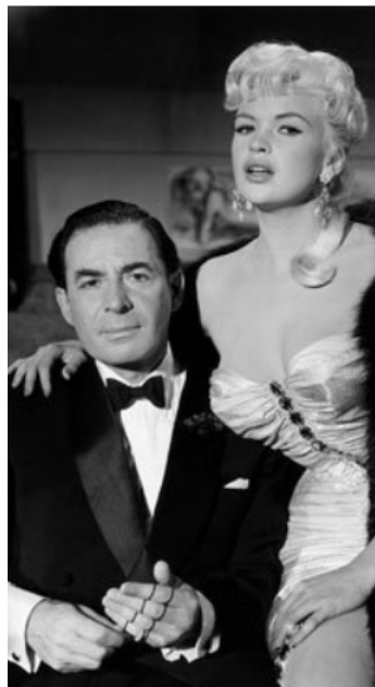
1959 LA BLONDE ET LES NUS DE SOHO (Too hot to handle) de Terence Young avec Jayne Mansfield