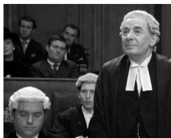
1973 LE PIÈGE (The Mackintosh Man) de John Huston avec Aileen Lewis