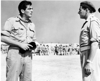
1957 LA BRIGADE DES BÉRETS NOIRS (No time to die) de Terence Young avec Victor Mature