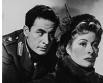
1950 L'HISTOIRE DES MINIVER (The Miniver Story) d'H. C. Potter avec Greer Garson