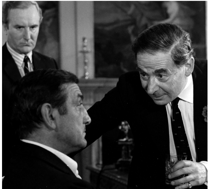
1972 LE SILENCIEUX de Claude Pinoteau avec Lino Ventura