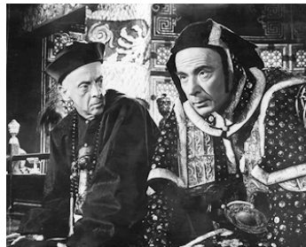
1963 LES 55 JOURS DE PÉKIN (Fifty-five days at Peking) de Nicholas Ray avec Robert Helpmann