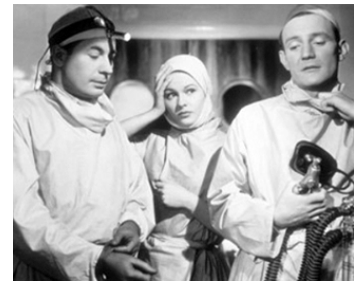
1946 LA COULEUR QUI TUE (Green for Danger) de Sidney Gilliat avec Sally Blane, T. Howard