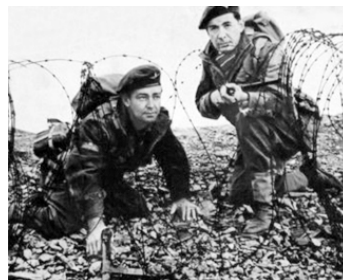
1953 LES BÉRETS ROUGES (Paratroopers) de Terence Young avec Alan Ladd