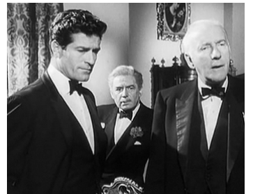
1965 DIX PETITS INDIENS (Ten little Indians) de G. Pollock avec H. O'Brian, W. Hyde-White