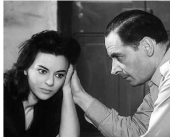
1959 LES ÉVADÉS DE LA NUIT (Era notte a Roma) de Robert Rossellini avec Giavanna Ralli