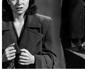
1948 LA FOSSE AUX SERPENTS (The Snake Pit) d'Anatole Litvak avec Olivia de Havilland