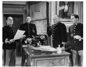
1957 L'AFFAIRE DREYFUSS (I accuse) de J. Ferrer avec Herbert Lom, Harry Andrews, G. Coulouris