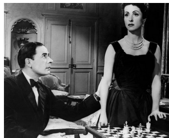
1955 L'AMANT DE LADY CHATTERLEY de Marc Allégret avec Danielle Darrieux