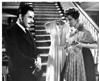
1953 LES BELLES DE L'ÎLE DU PLAISIR (The Girls of Pleasure Island) d'H. Herbert avec E. Lanchester