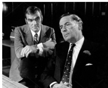
1970 LE VENIN DE LA PEUR (Una lucertola con la pelle di donna) de L. Fulci avec Stanley Baker