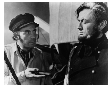
1956 MOBY DICK (Moby Dick) de John Huston avec Gregory Peck