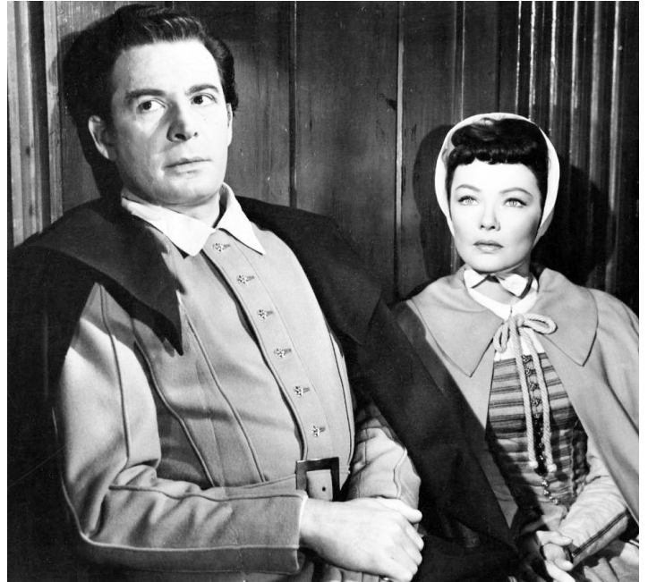
1952 CAPITAINE SANS LOI (Plymouth Adventure) de Clarence Brown avec Gene Tierney