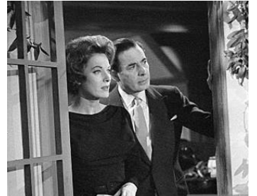
1960 MADAME MINNIVER (Mrs Minniver) de Marc Daniels avec Maureen O'Hara