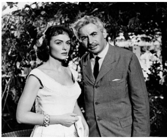
1956 AU SUD DE MOMBASA (Beyond Mombasa) de George Marshall avec Donna Reed