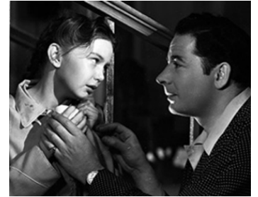
1949 JENNIFER (No place for Jennifer) d'Henry Cass avec Rosamund John