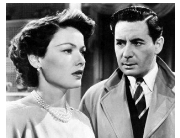
1953 UNE AFFAIRE TROUBLANTE (Personal Affair) d'Anthony Pelissier avec Gene Tierney