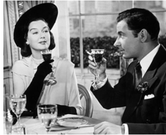
1948 QUAND LE RIDEAU TOMBE (The Velvet Touch) de John Gage avec Rosalind Russell