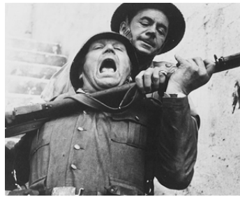
1956 LE COMMANDO SACRIFIÉ (The Steel Bayonet) de Michael Carreras