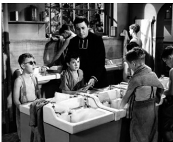
1954 LE FOULARD VERT (The Green Scarf) de George More O'Ferrall