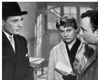
1955 CHANTAGE de Guy Lefranc avec Magali Noël, Raymond Pellegrin