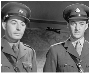
1944 L'HÉROÏQUE PARADE (The Way Ahead) de Carol Reed avec David Niven