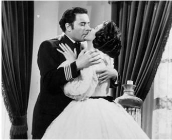
1947 LE DEUIL SIED À ÉLECTRE (Mourning becomes Electra) de Dudley Nichols avec Rosalind Russell