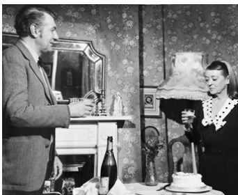
1969 CHAMBRES COMMUNICANTES (Connecting Rooms) de Franklin Gollings avec Bette Davis