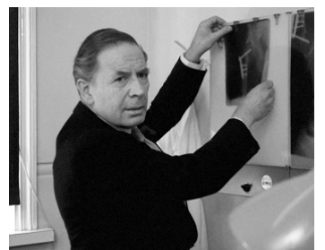
1974 FRIGHTMARE, LA GRANDE FRAYEUR (Frightmare) de Pete Walker